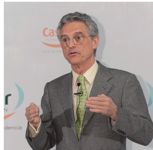
Dr. Luis Rojas Marcos

Ponente Ciclo de conferencias F. Caser 2012