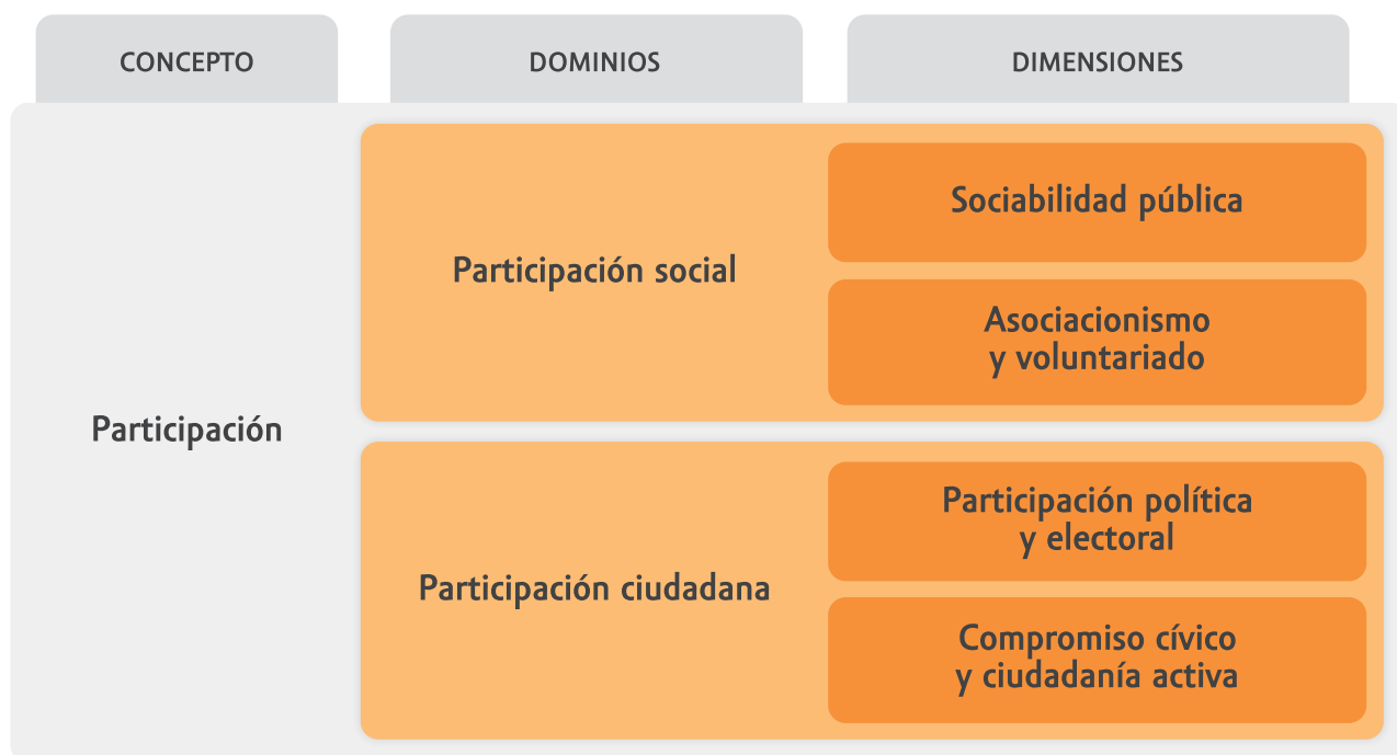
Figura 1: Estructura dimensional para el análisis de la participación de las personas mayores.

A pesar de que, como se ha mencionado, la participación es un recurso discursivo habitual en las declaraciones de intenciones institucionales sobre planificación comunitaria y que este ámbito de estudio ha sido objeto de un acervo cada vez mayor de investigaciones, el crecimiento de un cuerpo teórico o conceptual sobre la idea de participación no ha producido definiciones conceptuales comunes o consensuadas. De hecho, es relativamente escasa la producción teórica en torno a tipologías de las diferentes formas de participación existentes. Para tratar esta cuestión, el presente estudio asume una conceptualización multidimensional de la participación de las personas mayores (Ramos-Feijóo y Francés-García, 2023) nutrida de diferentes aportes, que presenta dos grandes dominios (participación social y ciudadana) y cuatro dimensiones básicas (participación política y electoral; ciudadanía activa y compromiso cívico; asociacionismo y voluntariado; y finalmente sociabilidad pública). La estructura de esta conceptualización queda representada en la Figura 1.