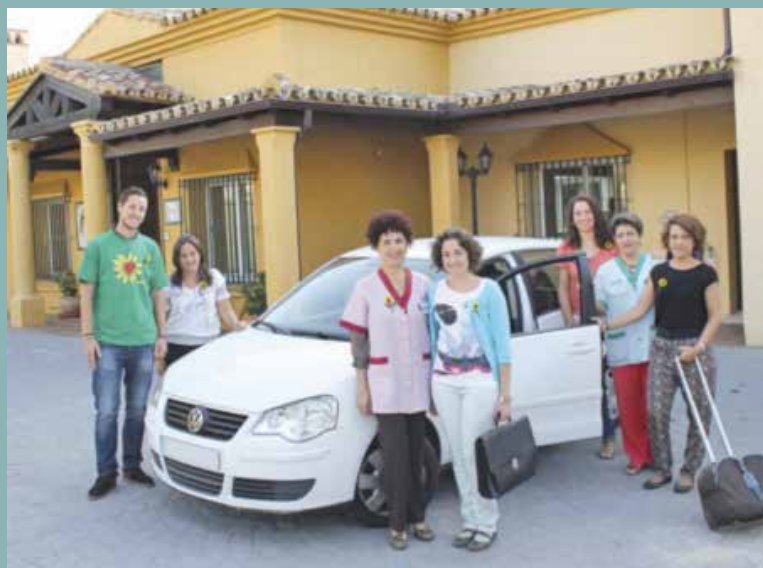
Equipo del Programa de Atención a Domicilio de la Fundación CUDECA: médica, enfermera, psicóloga, trabajadora social y voluntarios.