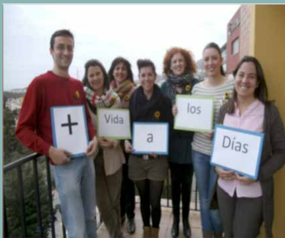
Equipo psicosocial de FUNDACIÓN CUDECA, un elemento más de la red asistencial

separado ya que actúan siempre coordinados con un mismo fin: añadir vida a los días.